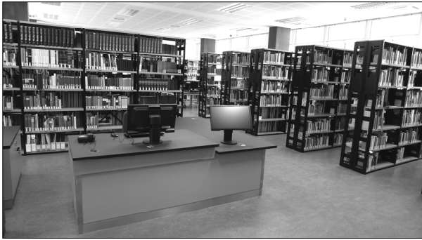
Blick in die Bibliothek im 1. OG