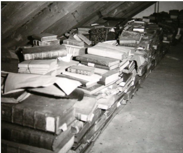
Provisorische Zwischenlagerung von UB-Beständen auf dem Nordostspeicher der Ludwig-Maximilians-Universität (um 1959)