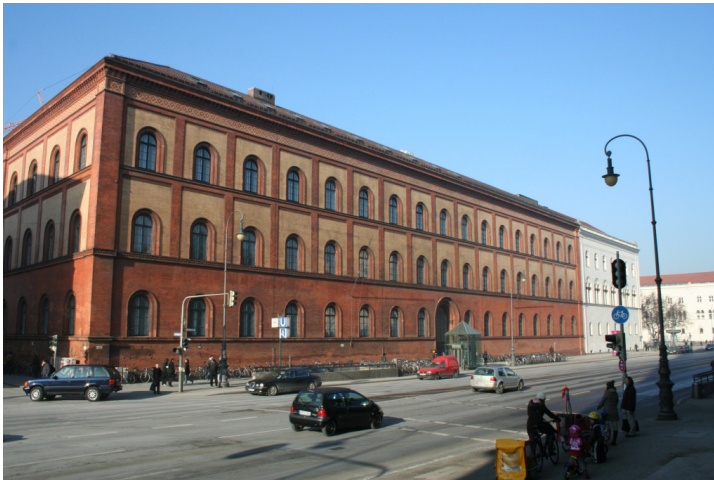
Historische Außenfassade der UB München an der Ludwigstraße

einer Hochschule nur bedingt diene, aber von den Ludwig-Maximilians-Universitäts-Studierenden zur Zerstreuung und Freizeitgestaltung dankbar angenommen wurde und wird. Um dem drohenden Magazininfarkt zu entgehen, erhielt die Universitätsbibliothek 1990 ein Ausweichmagazin in Planegg, einem Vorort im Münchner Süden, der sich 20 Kilometer von der Bibliothekszentrale entfernt befindet. Das weitläufige, mehrgeschossige Gebäudeareal beheimatete früher die alte Planegger Schlossbrauerei; während des Zweiten Weltkriegs fungierte der weiß getünchte Bau mit seinen teilweise drei Stockwerke tiefen Kellern als Luftschutzraum und Sanitätsdepot der Wehrmacht. Nach Kriegsende diente er der Bayerischen Staatsbibliothek als Ausweichquartier, die ihn bis zur Fertigstellung ihres Speichermagazins in Garching nutzte. Das Planegger Ausweichmagazin beherbergt heute unter anderem den größten Teil des Altbestandes; in ihm befinden sich fast drei Viertel der rund 475.000 alten Drucke des Erscheinungszeitraums 1501 bis 1900, von denen durchschnittlich über 8.000 im Jahr zur Benutzung im Lesesaal Altes Buch bereitgestellt werden. Doch auch im Planegger Ausweichmagazin mit einer Hauptnutzfläche von 5.000 Quadratmetern sowie einem Fassungsvermögen von 25.000 Regalmetern zeichnen sich bereits die Grenzen des Wachstums ab, denn über vier Fünftel der zur Verfügung stehenden Stellfläche sind schon belegt.