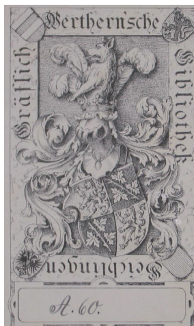
Abb.1: Scan eines Exlibris der Gräflich Werthern'sche Bibliothek

So befanden sich in dem Konvolut einige Bände der „Illustrierten Zeitung“ mit einem Exlibris, das neben einem Wappen auch den Namen des Eigentümers preisgibt: Gräflich Werthern'sche Bibliothek.