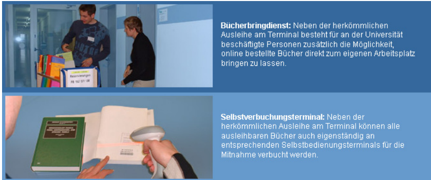
Abb. 2: Visualisierung und Beschreibung von Diensten im Bereich „Medienbereitstellung“

versitätsgebäuden gewährleistet, in denen entlehene Bücher rund um die Uhr zurückgegeben werden können. 9