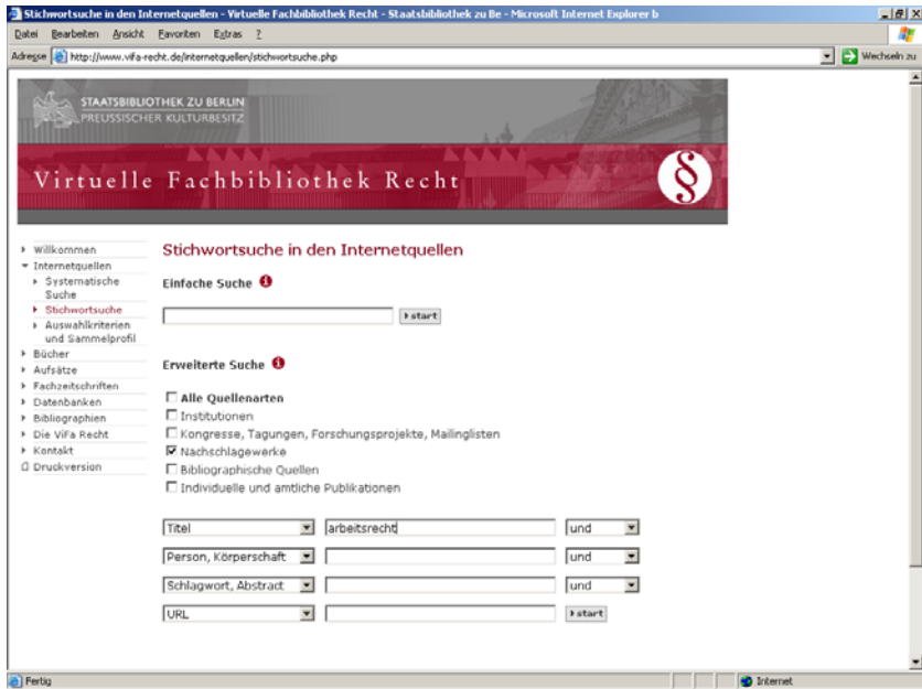
Abb. 2: Fachinformationsführer – Stichwortsuche

„Die intellektuelle (Erst-)Erschließung von Internetquellen ist eine ressourcenintensive Aufgabe, deren Notwendigkeit jedoch weitestgehend unbestritten ist“ 20 . Da Segmente relevanter Internetquellen in fachlich benachbarten Disziplinen einen hohen Überschneidungsgrad aufweisen und Mehrarbeit durch aufwändige Doppelerschließung an unterschiedlichen Standorten vermieden werden soll, hat sich die ViFa Recht einer Kooperation zwischen den Virtuellen Fachbibliotheken Politikwissenschaft 21 und Wirtschaftswissenschaften 22 angeschlossen.